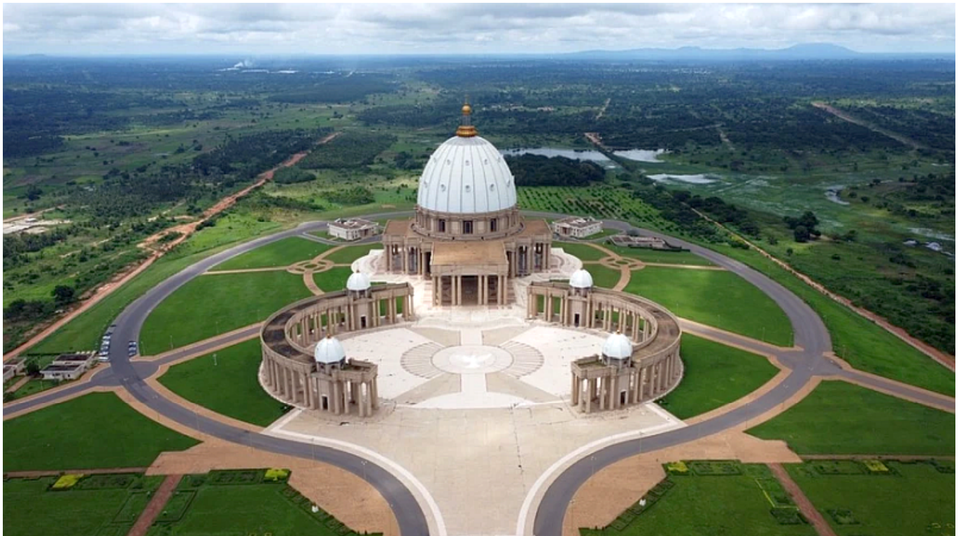
Basilique Notre-Dame de la Paix, a világ legnagyobb katolikus temploma

Mint például ebben az esetben, ugyanis a világ legnagyobb keresztény temploma nem a Vatikánban található, még csak nem is Izraelben, ahol a vallás született, hanem – ta-ta-ta-tam – Afrikában.