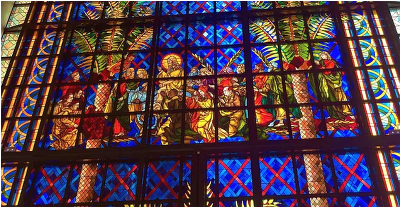
Basilique Notre-Dame de la Paix, mozaik-ablakok

személyesen Boigny térdel (azért értékelendő, hogy nem fordítva), társaságában kétoldalt a további szponzorok. A Coca-Cola, a FIFA vagy az Apple ezekben szerencsére nem képviseltette magát, ami komoly visszafogottságra vall részükről. Igen, létezik az a kifejezés, hogy ízléstelenség , de a diktátorok világában ez a szó szinte minden esetben a jelentését veszti.