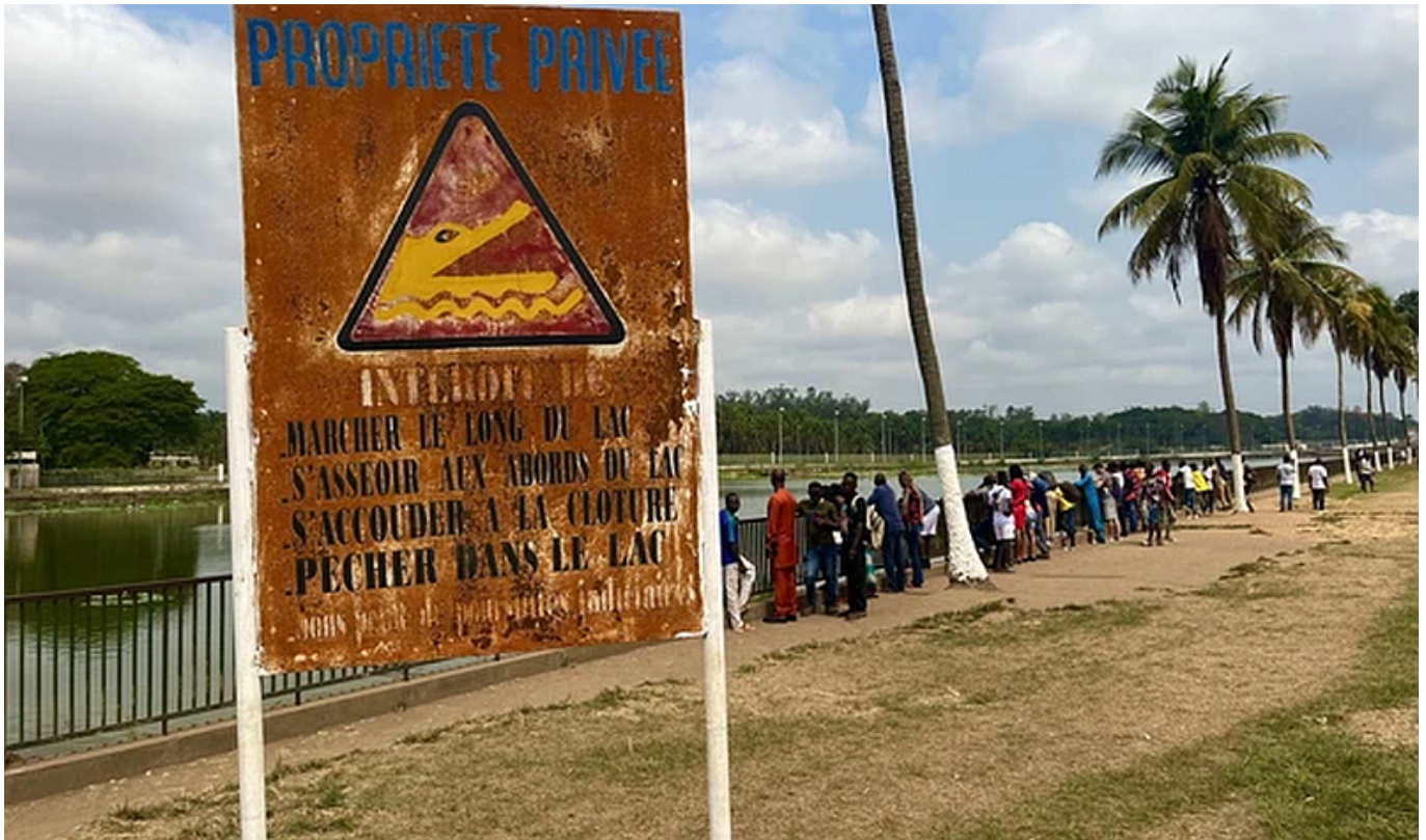
Le lac aux crocodiles

Hôtel Président: Igen, biztosan kijelenthető, hogy a diktátorok nagykönyvében az álnokság, becsvágy és gonoszság mellett az ízléstelenség is felvételi követelmény. Vagy ha személyesen nem sikerül ízléstelenné lennie, akkor ezt a feladatot delegálnia kell. Például olyan emberekkel, építészekkel veteti körbe magát, akik (be)teljesítik ezt a követelményt (is). Erre remek példa Yamoussoukro-ban a Hôtel Président, tetején egy külön étteremmel. Az elemzéséhez elfogytak a szavaim (ez azért annyira nem jellemző), beszéljen helyettük egy kép erről, az úgynevezett épületről: