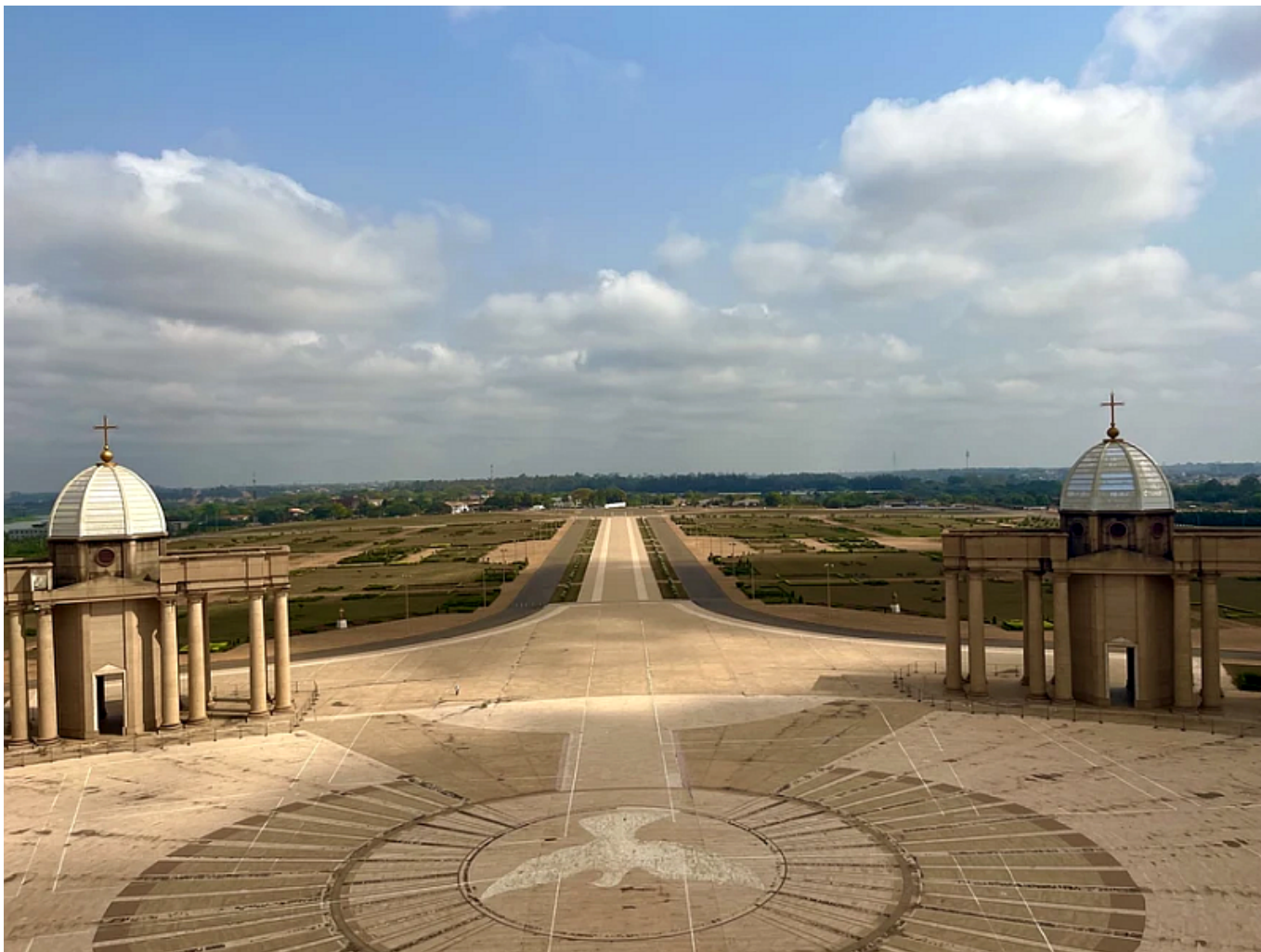
Basilique Notre-Dame de la Paix, a templom előtere

Levezetésként, mielőtt elkezdnénk párhuzamokat keresni mondjuk Felcsút és Yamoussoukro, az új főváros között lássuk a három látnivaló közül a továbbiakat a wannabe fővárosból: