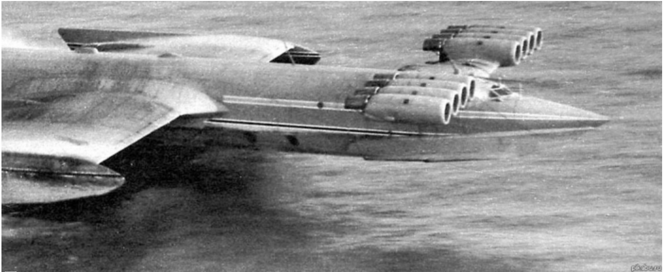
A KM-1 a levegőben

Időközben azonban a szovjet politikai széljárás (azok a fényes szellők, ugye, fújjátok-fújjátok) megváltozott, Hruscsovot 1964-ben menesztették hivatalából, helyére Leonyid Brezsnyev (kódneve: bozontszemöldök ) lépett. Ő mélyen szkeptikus volt a túlméretezett KM ekranoplánnal szemben, le is állította a fejlesztését.