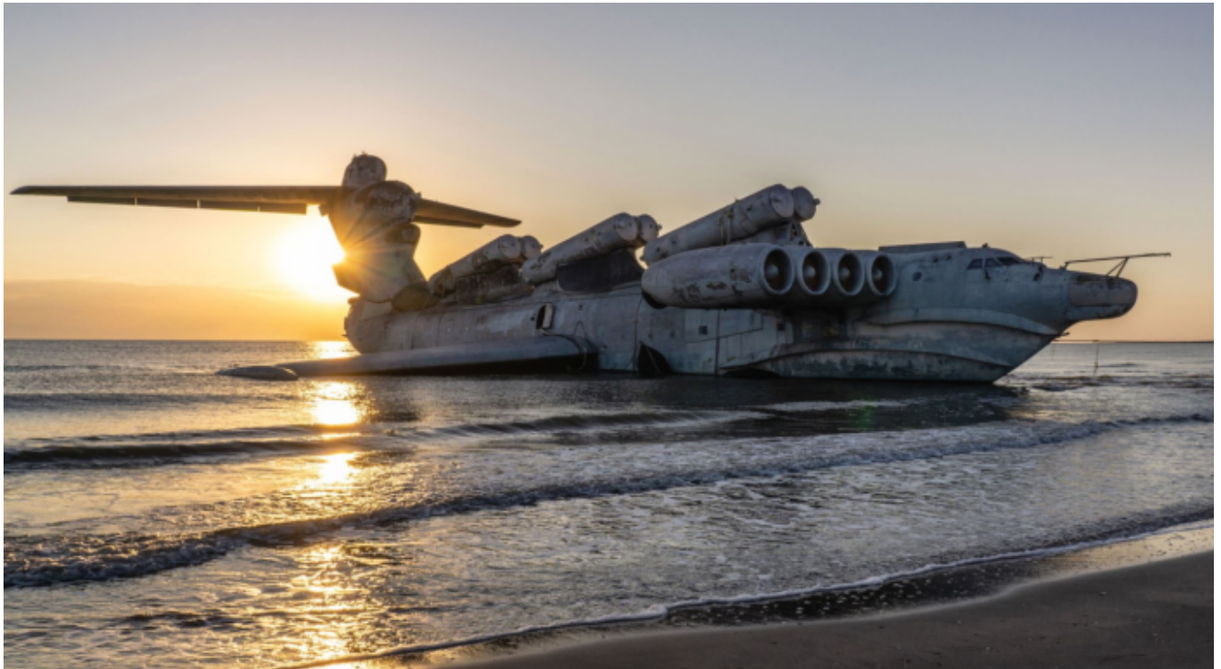
A LUN-osztályú MD-160, miután megfeneklett, fotó: Lana Sator