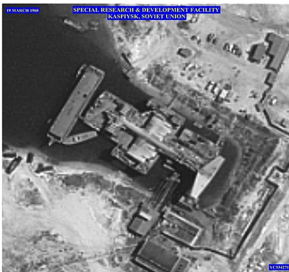
KH-8 Image of Kaspiysk Special Research and Development Facility on the Caspian Sea in the Former Soviet Union, 19 March 1968

Egyébként Rosztiszlav Alekszejev ugyanolyan meghatározó személyiség volt a szárnyashajók és ekranoplánok fejlesztésében, mint kortársa, Szergej Pavlovics Koroljov a szovjet űrprogramban (az ő szerepéről már írtam a Szputnyik-sokk című bejegyzésben). A hajótestet részekre bontva, csaknem egy hónapon keresztül éjszakánként szállították a Kaszpi-tengeri Kaspisig . Az elrejtésére szolgáló igyekezet bizonyos szempontból felesleges volt, a szörnyet a Kaszpi-tengeri szárazdokokban az amerikaiak a CIA műholdfelvételein gyorsan kiszúrták.