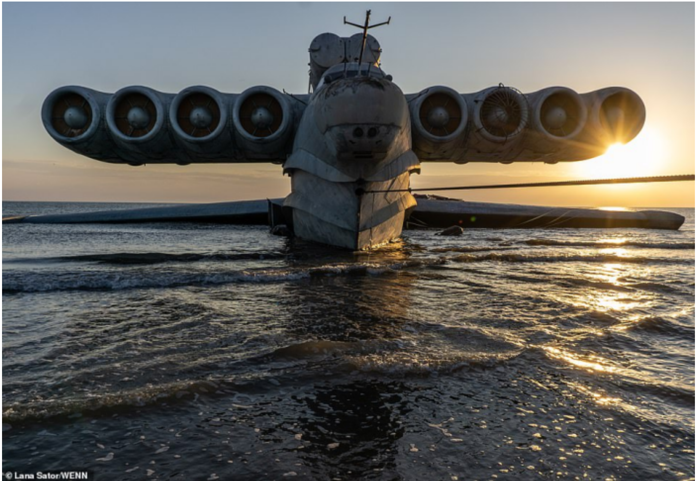
A LUN-osztályú MD-160 partra vetetten