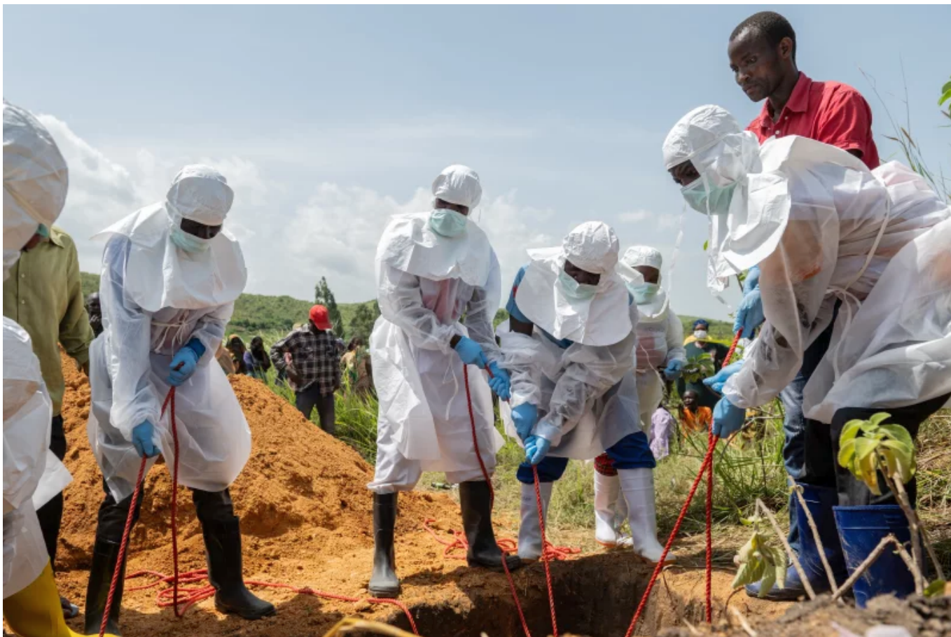
Vöröskereszt munkatársai egy ebolás áldozatot temetnek a Rwampara temetőben, Rwampara városában, Kongóban, 2026. május 23-án.

Az ember ritkán fertőződik meg közvetlenül denevérektől. Gyakori, hogy a denevérek által megrágott, vírusos gyümölcsöket vagy a földre hulló váladékukat más erdei állatok – csimpánzok, gorillák, antilopok, sündisznók – fogyasztják el, amelyek viszont már súlyosan megbetegednek a vírustól.